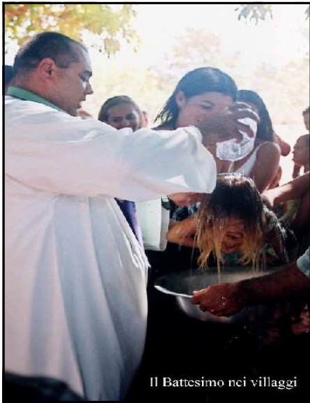
Il Battesimo nei villaggi

cidade de Tocantinópolis, que me ofereceram colares feitos por eles com sementes de fruta. Tive a possibilidade de participar no baptismo de crianças e de adultos nas aldeias e testemunhar à comunidade, na igreja e nas escolas, a fé e as expectativas que animam as muitíssimas pessoas que acolheram o Sustento à Distância, tornando-se padrinhos e madrinhas das crianças de Sete Lagoas e Wanderlândia. São mesmo estas pessoas que se fazem porta-voz com amigos e conhecidos, que esperam com trepidação as cartas e as fotografias dos seus meninos porque estes novos afectos são já parte integrante da vida deles. O Sustento à Distância, ou seja sustento, cuidado e estudos, não é endereçado só à pessoa adoptada mas também à sua família e à comunidade de