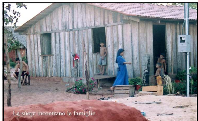
Le suore incontrano le famiglie

Reservas que lhes foram destinadas pela FUNAI (Fundação Nacional do Índio), órgão do governo federal, continuam a sofrer com as injustiças e a violência dos fazendeiros e dos garimpeiros. Incansáveis as irmãs vão pelas aldeias para ajudar as famílias, para servir de intermediário entre as pessoas e as instituições, para trazer conforto e sustento e o testemunho Daquele Cristo que não abandona nem esquece ninguém. Naqueles dias, partilhando o quotidiano delas participei completamente do seu apostolado e compreendi que