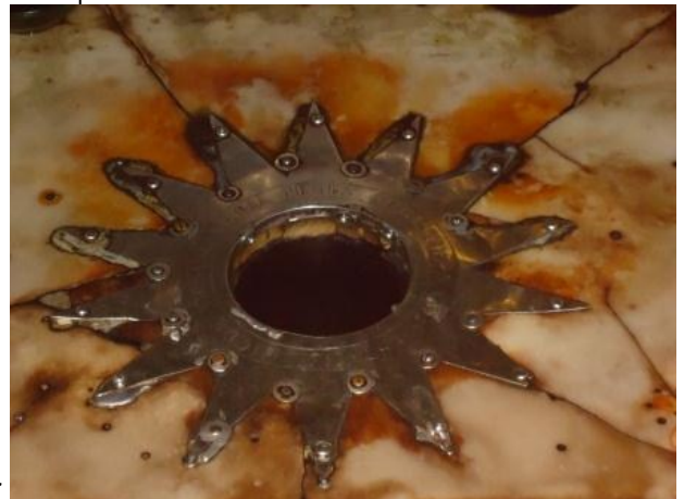
Bethlehem - Grotta della Natività