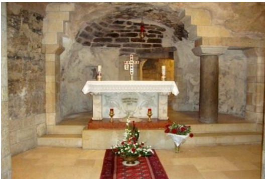
Nazareth - Casa di Maria

Il nostro pellegrinaggio in Terra Santa ha avuto inizio alla sua fine, quando ognuno di noi ha realizzato di aver fatto tanti viaggi con il proprio corpo ma pochi con la propria anima. Percorrere le tracce bibliche del cammino di Gesù è stato uno straordinario viaggio dello spirito. Siamo partiti dalla Grotta