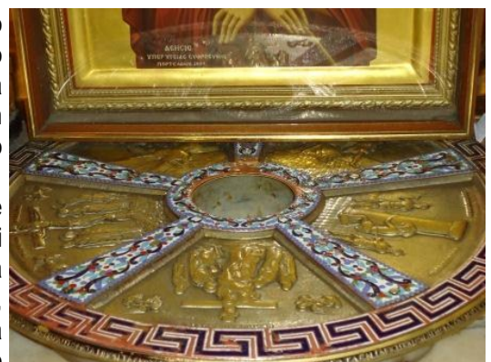
Jerusalem - Calvario

L'Orto del Getsemani è stata un'altra tappa ricca e densa di significato, qui, abbiamo scoperto la nostra fragilità insieme alla fragilità di Gesù, ne abbiamo avvertito la paura, la disperazione, la lotta del vivere quotidiano. Questo luogo ci ha rivelato non solo la condizione della nostra fragilità umana, ma ha anche fatto emergere quanto e come ognuno di noi è stato Giuda tutte le volte in cui non è stato all'altezza dell'amore di Dio; in questo posto ognuno di noi ha chiesto intimamente perdono per tutte le volte in cui non è stato vigile nel riconoscere